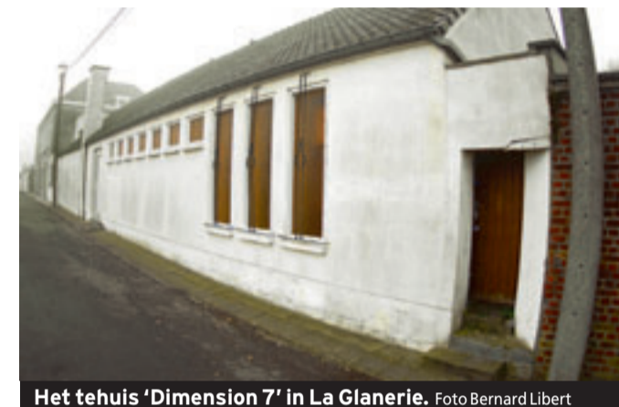
Het thuis 'Dimension 7' in La Glanerie.